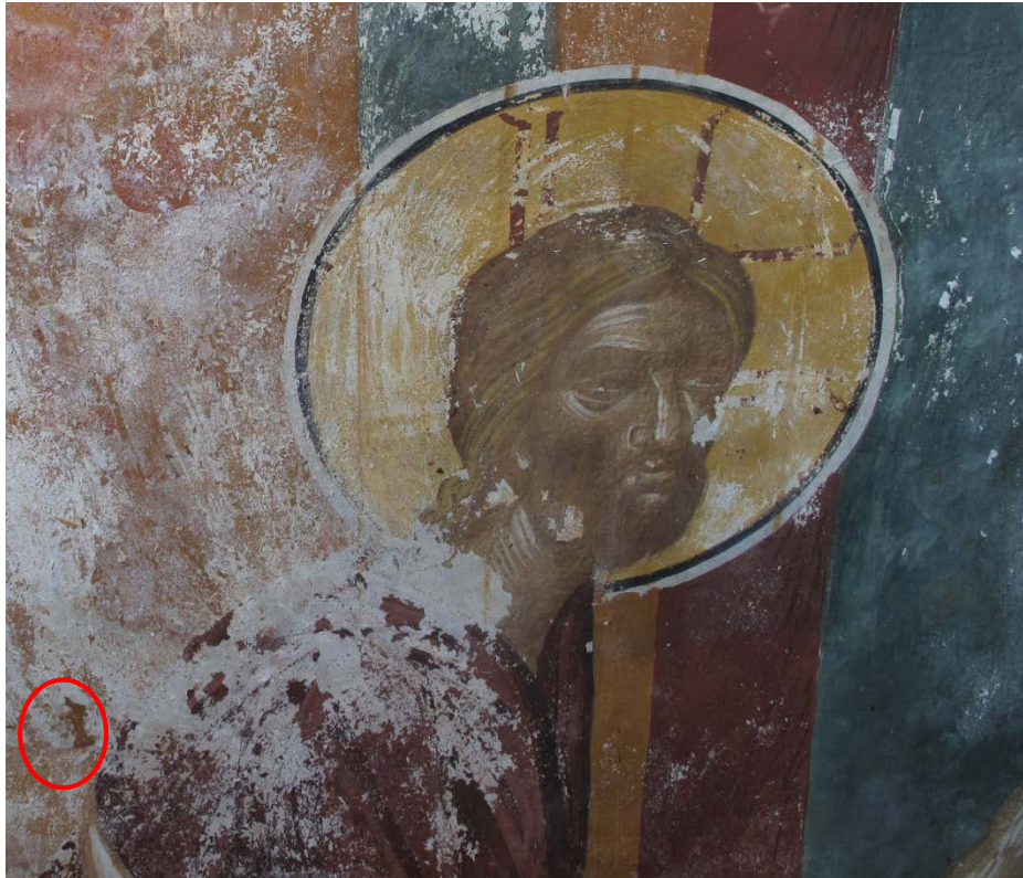
2021 წლის 29 აპრილი