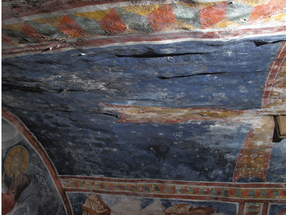
2021 წლის 29 აპრილი