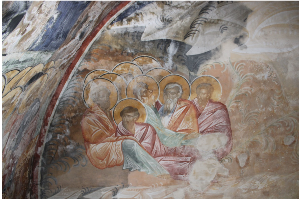
2021 წლის 29 აპრილი