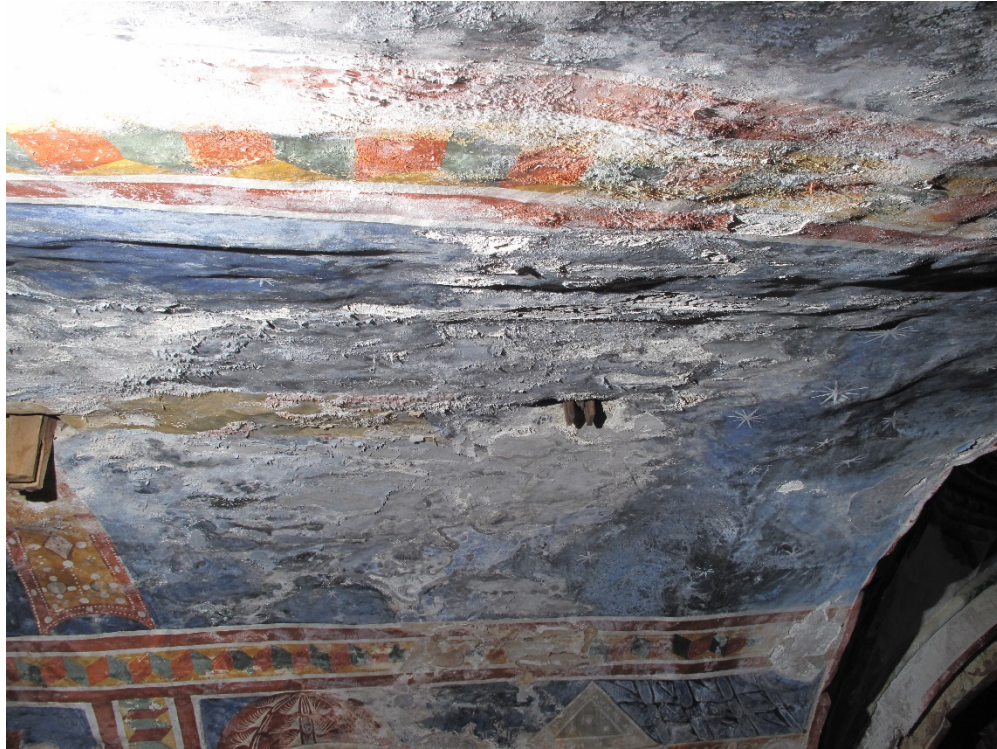
2021 წლის 29 აპრილი