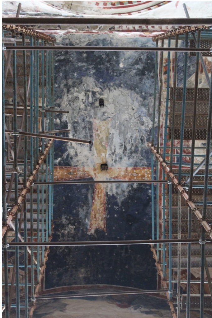
2021 წლის 29 აპრილი