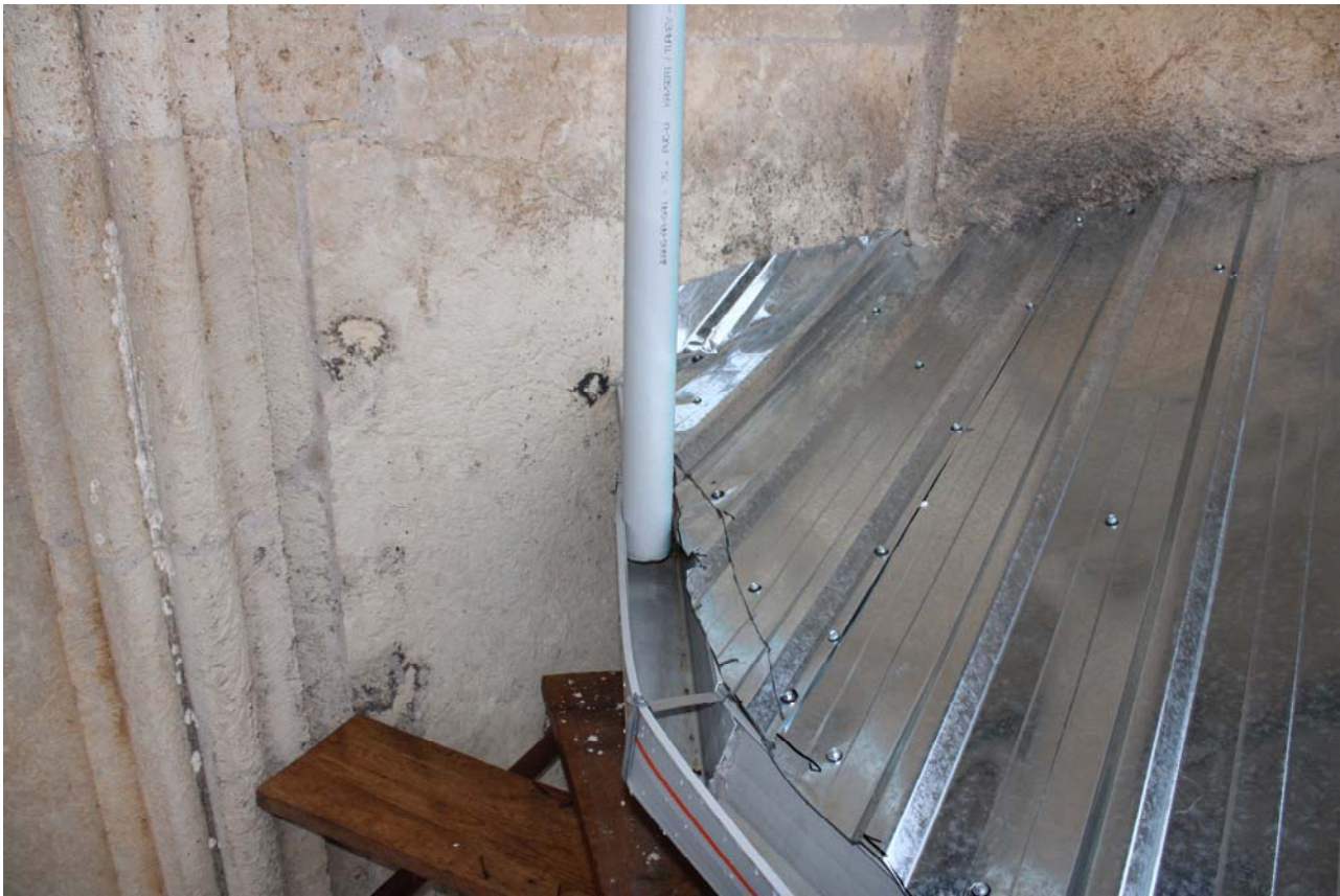
არასწორად განაწილებული და დამონტაჟებული წვიმსადინრები მთლიანად შესაცვლელია.